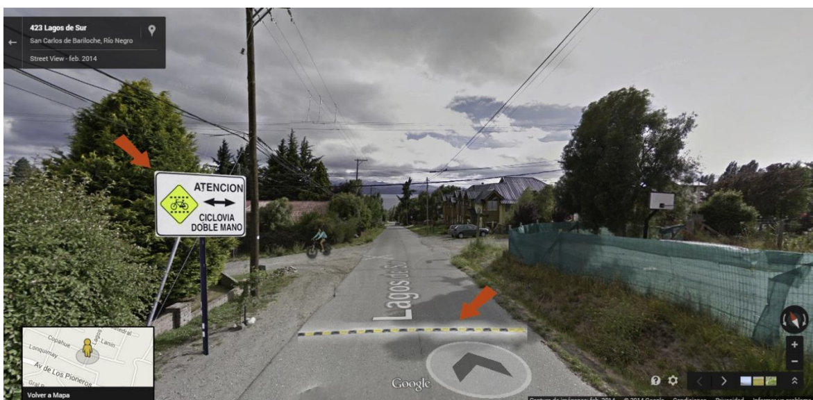
Imagen 1: señalización de advertencia en cruces asfaltados.

Luego, en la medida en que se pueda encontrar recursos, se irá sumando la infraestructura necesaria: estacionamientos para bicis, cartelería informativa, iluminación, bebederos, etc.